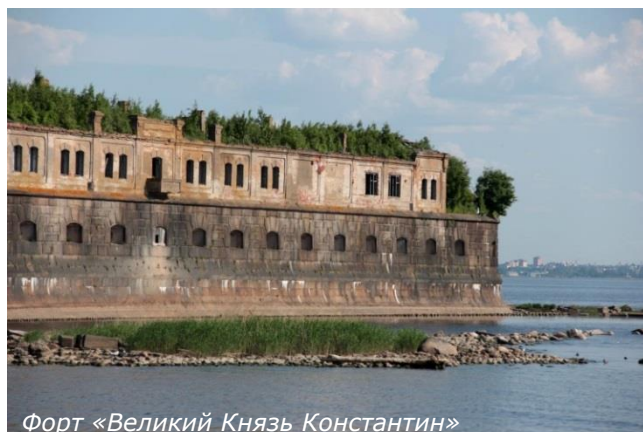
Форт «Великий Князь Константин»